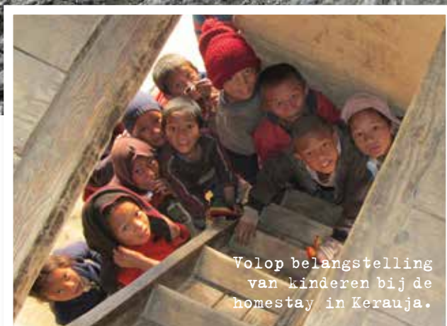
Volop belangstelling van kinderen bij de homestay in Kerauja.