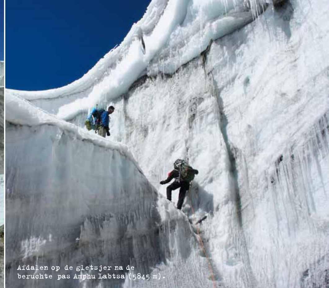
Aidalen op de gletsjer na de beruchte pas Anphu Labtsa (5845 m).