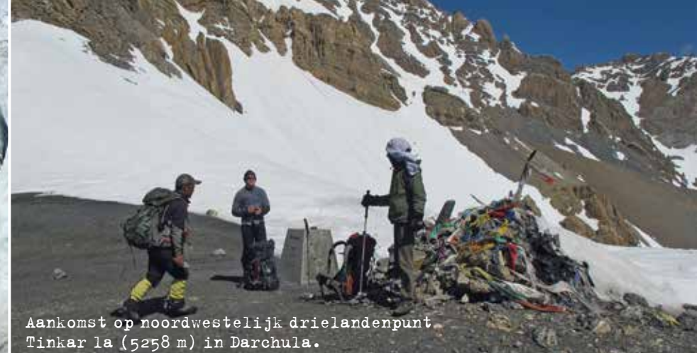
Aankomst op noordwestelijk drielandpunt Tinkar la (5258 m) in Darchula.