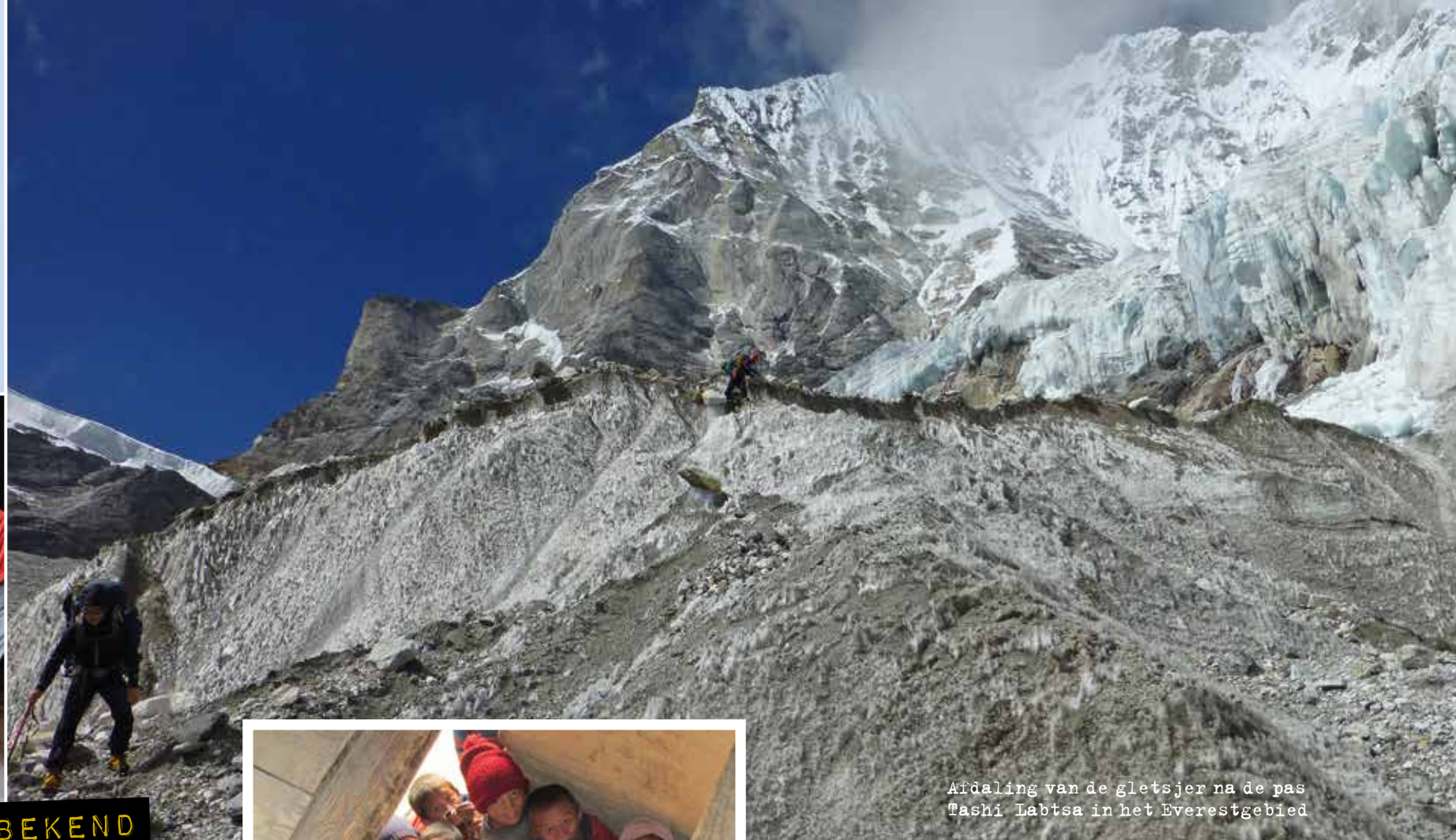
Afdaling van de gletsjer na de pas Tashi Labtsa in het Everestgebied