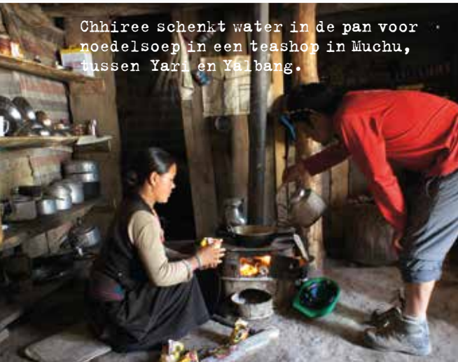
Chhiree schenkt water in de pan voor noedelsoep in een teashop in Muchu, tussen Yari en Yalbang.