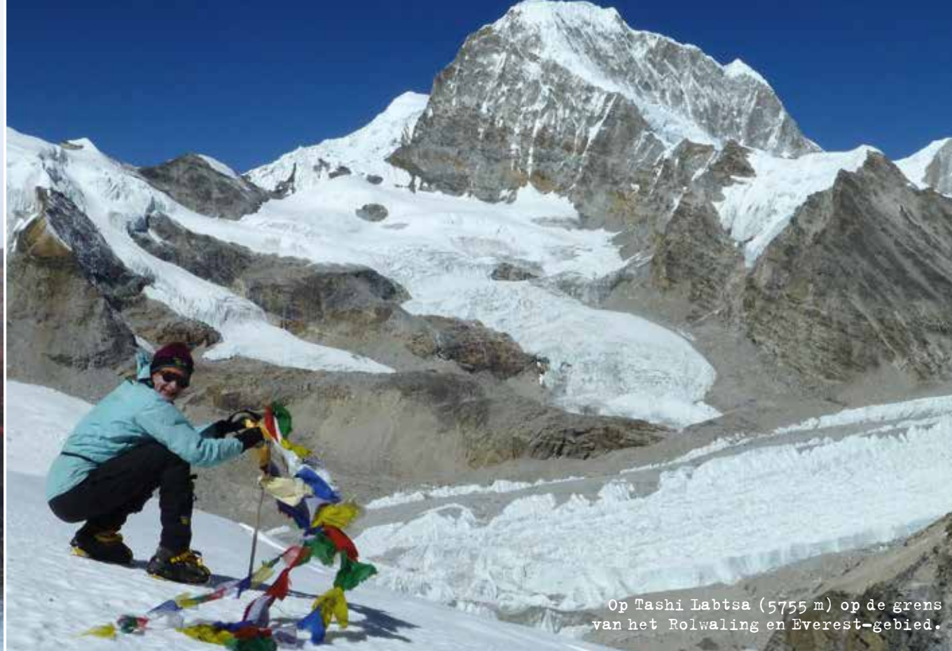
Op Tashi Labtsa (5755 m) op de grens van het Rolwaling en Everest-gebied.